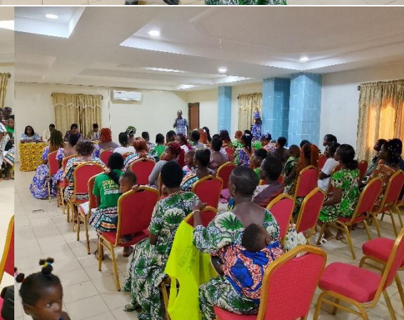
Cérémonie de clôture de la mission de volontariat dans la Commune Golfe 7