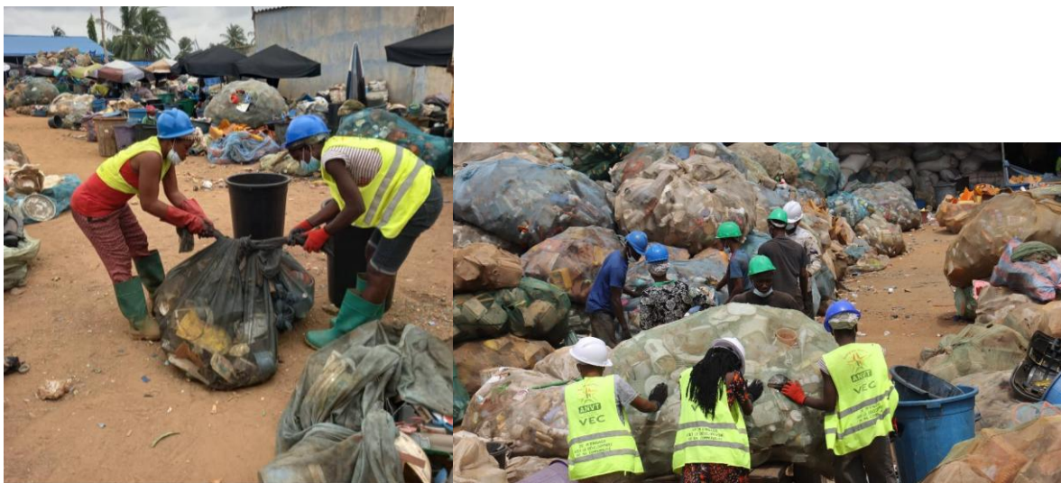
Manutention des matières pour les opérations de tri