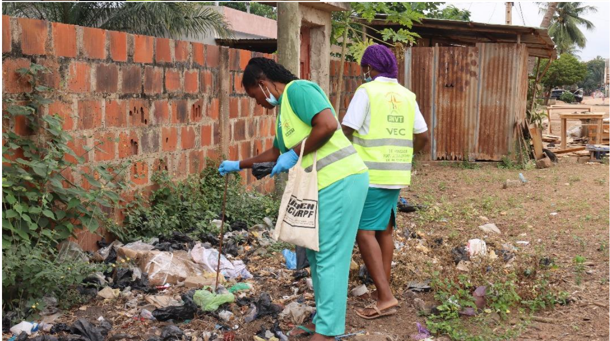
Sensibilisation et opération de salubrité dans le quartier Avénou