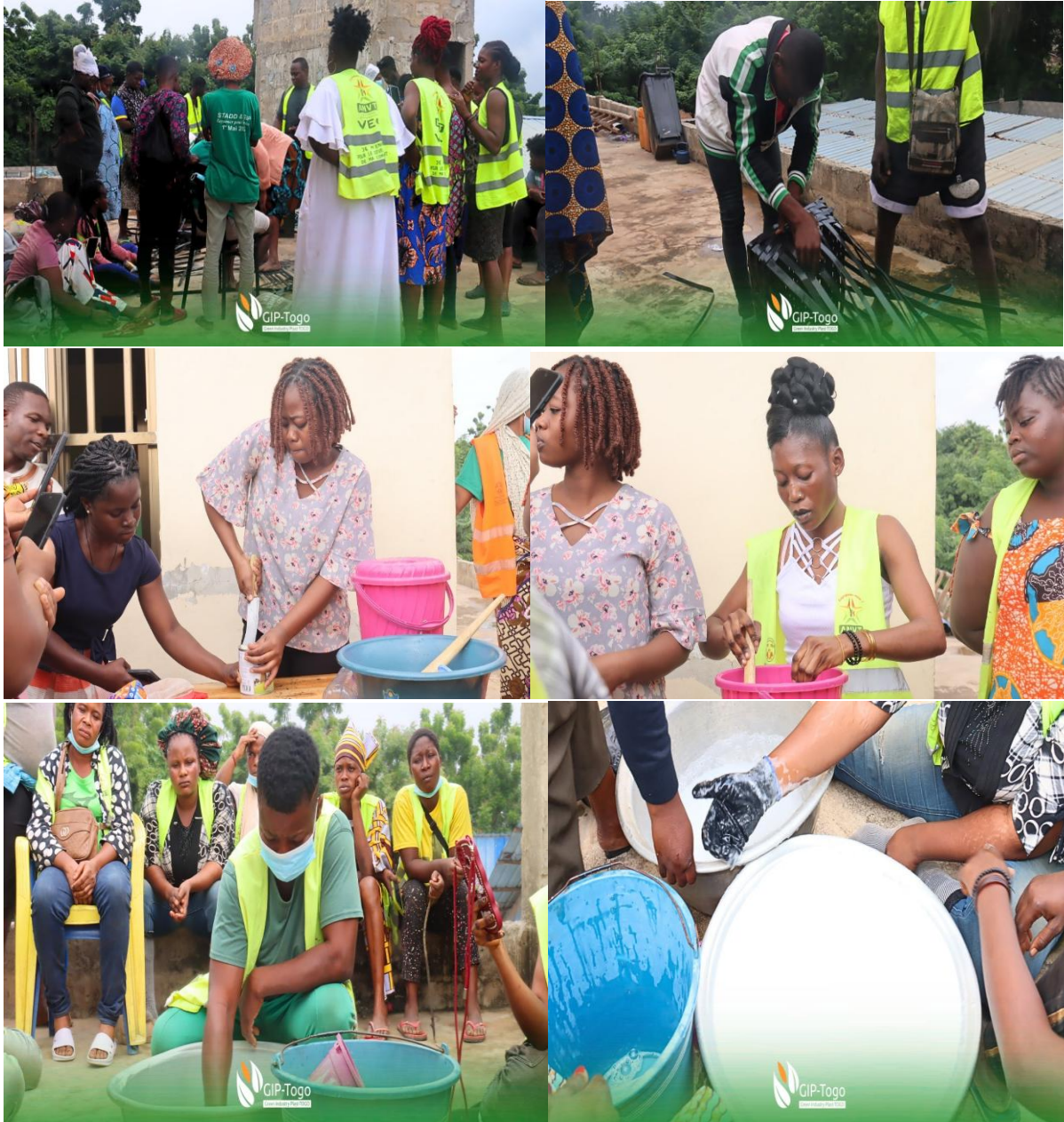
Ateliers de formation pratique des VEC sur les AGR