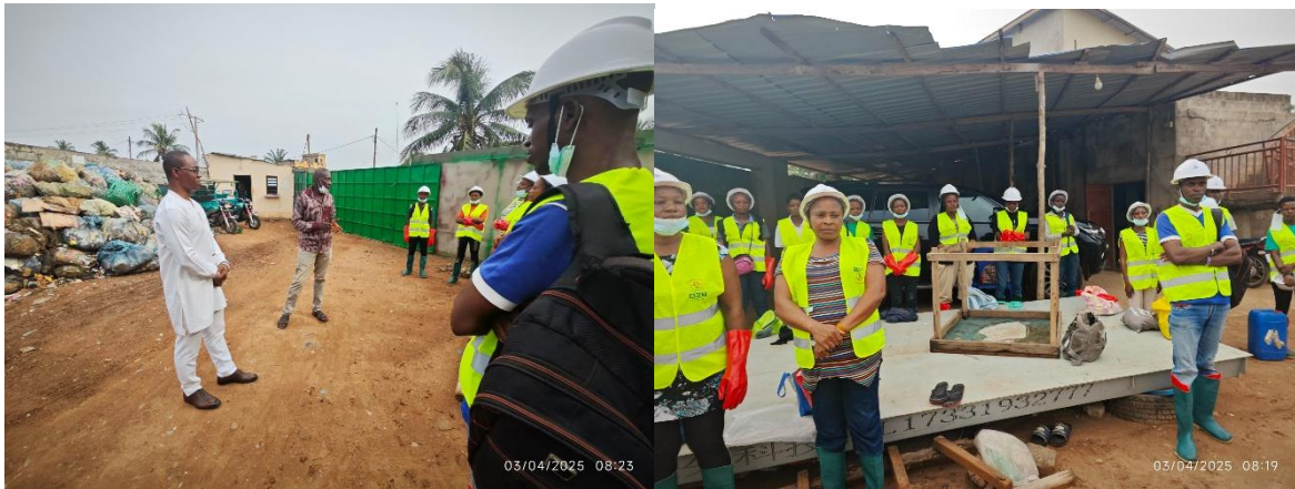
Accueil et partage des informations relatives à la mission